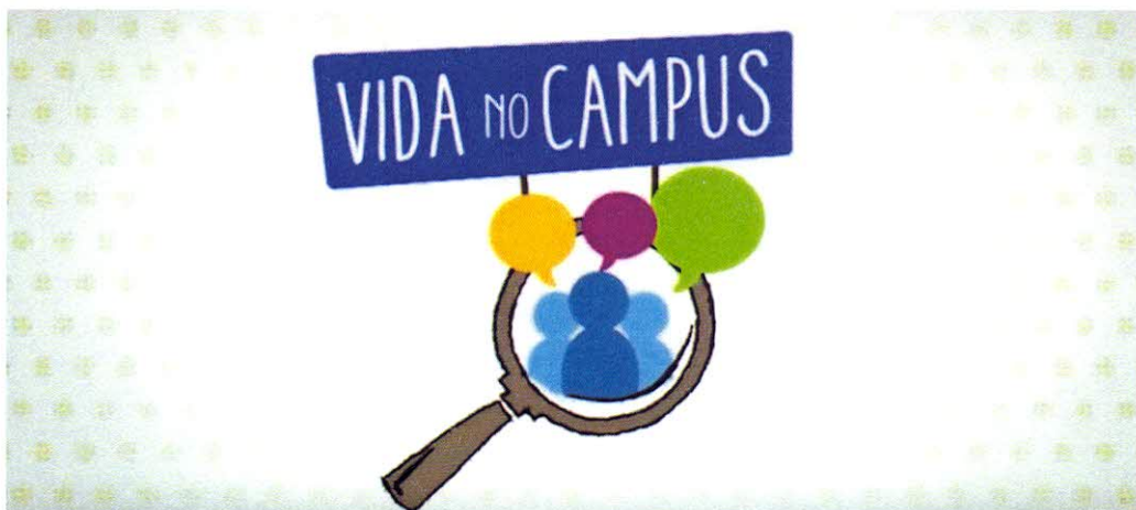
Abertura do quadro Vida no Campus